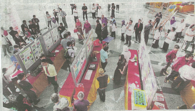
PAMERAN MyINOVASI 2014 terima ramai pengunjung.