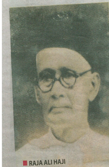
■ RAJA ALI HAJI

Raja Ali Haji terus dikagumi, pengaruh masyarakat empayar Johor - Riau