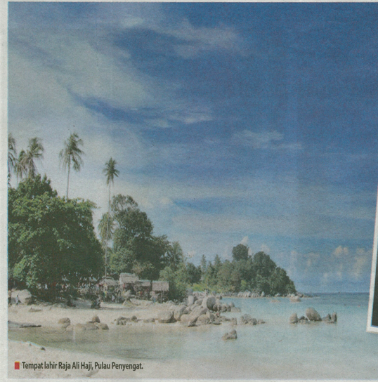
■ Tempat lahir Raja Ali Haji, Pulau Penyangat.