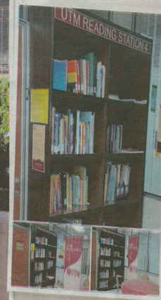
■ Ruang bacaan di UTM, Skudai.