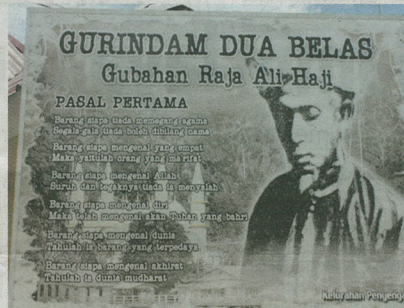
■ Gurindam Dua Belas

Selepas tahun 1883 wujud beberapa sekolah lagi di negeri