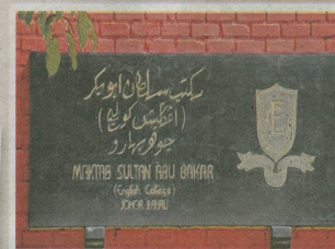
■ Maktab Sultan Abu Bakar.