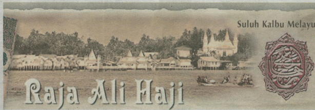
■ Suluh Kalbu Melayu

lebih jelas lagi dalam puisi gurindam yang dihasilkan Raja Ali Haji. Beliau yang berpendidikan Arab mengekalkan Bahasa Melayu klasik tetapi mengambil banyak pengaruh perkataan dan struktur Arab.