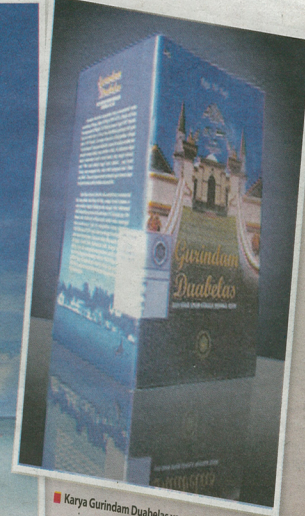
■ Karya Gurindam Dua Belas yang dibukukan.

Johor seperti Sekolah Melayu Johor Bahru, Sekolah Melayu Pengerang, Sekolah Melayu Padang, Sekolah Melayu Tanjung Surat, Sekolah Inggres Johor Bahru, Sekolah Pertanian Johor dan Johor Technical School.