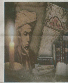
■ Karya Raja Ali Haji.