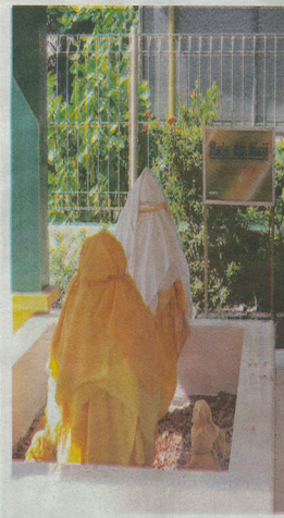
■ Makam Raja Ali Haji.