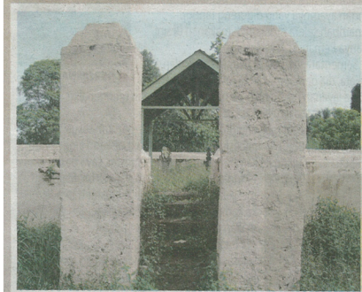
■ Makam Tauhid.