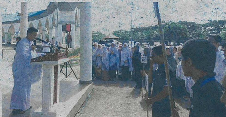
Pelajar mendengar taklimat daripada urusetia sebelum mereka melakukan simulasi haji yang dianjurkan oleh UTHM dengan kerjasama PPD Batu Pahat dan Tabung Haji.