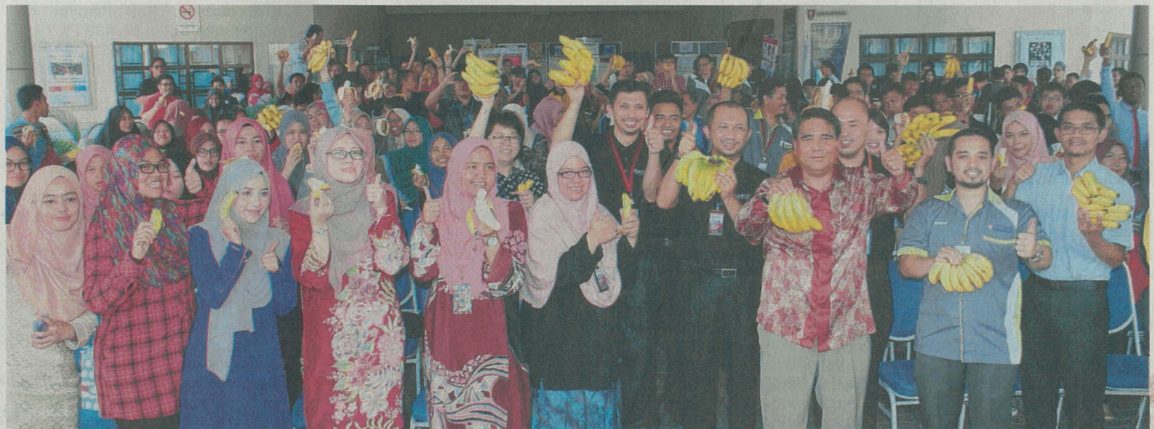
SEBAHAGIAN daripada tenaga pensyarah dan pelajar yang menjayakan kempen #PisangFKEE bagi meningkatkan hubungan antara fakulti dan pelajar.