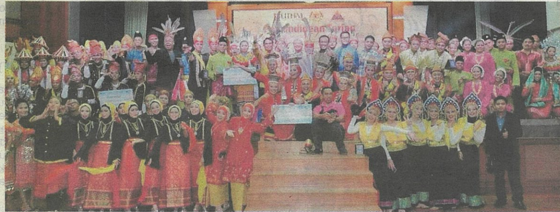
Kelab Warisan Tari UTHM merangkumi kumpulan tari zapin, inang, joget, moden, jazz, randai dan banyak lagi termasuk tarian dari Sabah serta Sarawak.

"Kepelbagaian seni tari berkenaan akan memberi