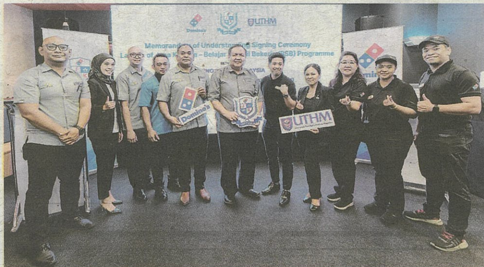
MENERUSI program Jana Kerjaya, pihak UTHM dan Domino's Pizza akan berkongsi manfaat secara bersama.